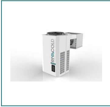
IMAGEN APROXIMADA DEL PRODUCTO