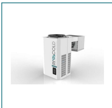
IMAGEN APROXIMADA DEL PRODUCTO