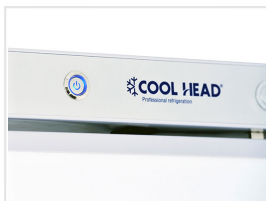
Interruptor principal retroiluminado (color azul)