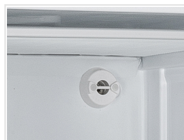
Válvula de presión para apertura fácil de puerta