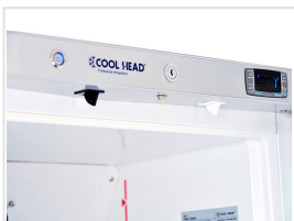
Alarma de apertura de puerta / alarma de temperatura alta