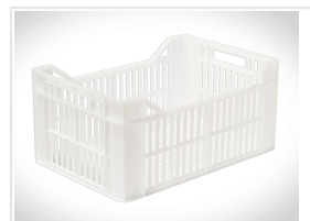
12 cajones (dim: 440 x 290 x 200 mm)