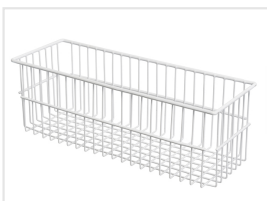
1 cajones inferiore (dim: 600 x 220 x 200 mm)