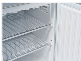
Rejilla de evaporador fijas