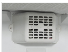
Ventilador interno de asistencia