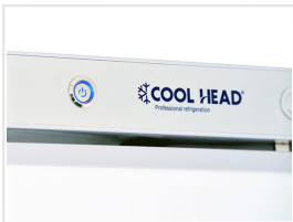
Interruptor principal retroiluminado (color azul)