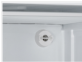
Válvula de presión para apertura fácil de puerta