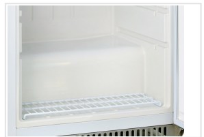
Estantería desmontable inferior de serie