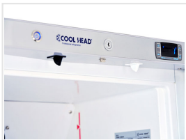
Alarma de apertura de puerta / alarma de temperatura alta