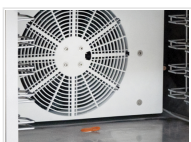
Protección del ventilador interno