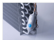
Evaporador con tratamiento anticorrosión