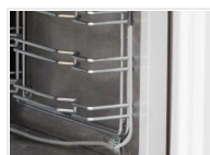
Freno termal anticondensación en el marco de la puerta