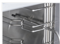
Sonda de aguja