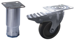
Los artículos pueden ser provistos con pies ajustables o con ruedas antivuelco