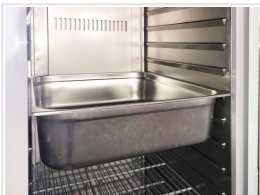
Armario para bandejas GN2/1