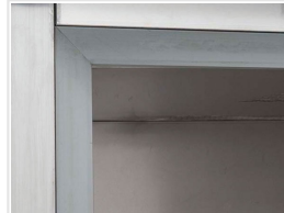
Freno termal anticondensación en el marco de la puerta