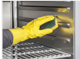
Guías onduladas interiores AISI 304