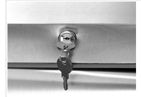
Cerradura de serie