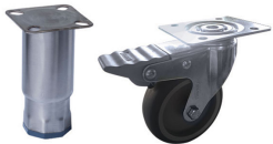
Los artículos pueden ser provistos con pies ajustables o con ruedas antivuelco