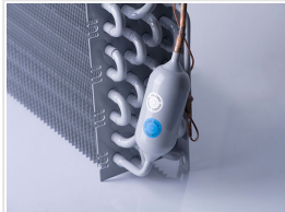
Evaporador con tratamiento anticorrosión