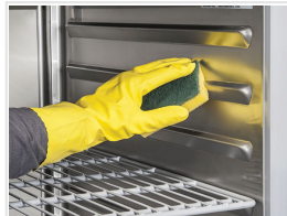
Guías onduladas interiores AISI 304