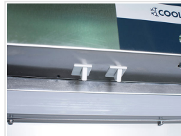
Alarma de apertura de puerta y alta temperatura de serie