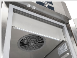
Luz superior horizontal LED