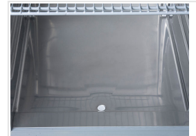
Hueco inferior para una limpieza y secado fácil