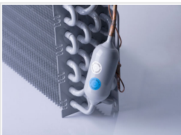
Evaporador con tratamiento anticorrosión