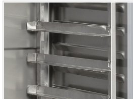
Set de guías Euronorm 600 x 800 mm (10 estantes por cada puerta)