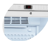
Termostato con alarma acústica y externa