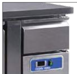
Cajón neutro en modelos conservación.