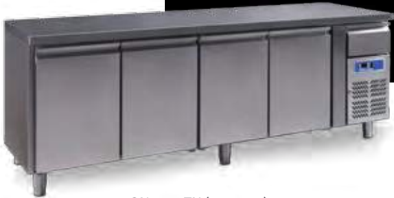
GN 4100 TN (4 puertas)