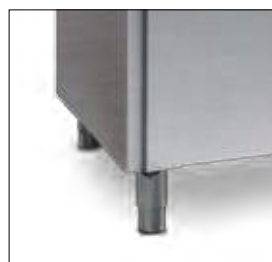
Pies regulables en altura.