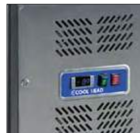
Termostato digital y cerradura de motor de serie.