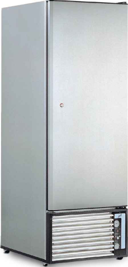
ABX 700 N