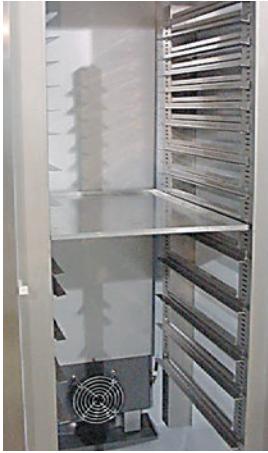
ABX 700 P (Versión Pastelería)