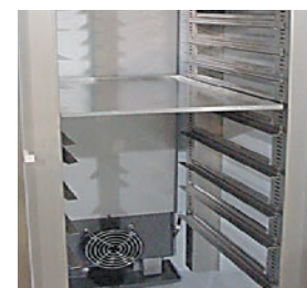
Ventiladores interiores para asegurar una distribución uniforme del aire frío.