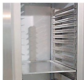
Modelos ABX 700 con interior en acero lacado.