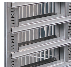
Estructura interior para colocar bandejas pasteleras de 40 x 60 cm.