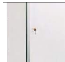
Incorporan cerradura con llave.