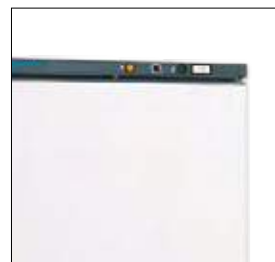
Control de mandos con: piloto de encendido, interruptor congelación rápida, termostato, termómetro.