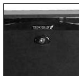
Cerradura en todos los modelos.