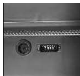
Luz interior LED.