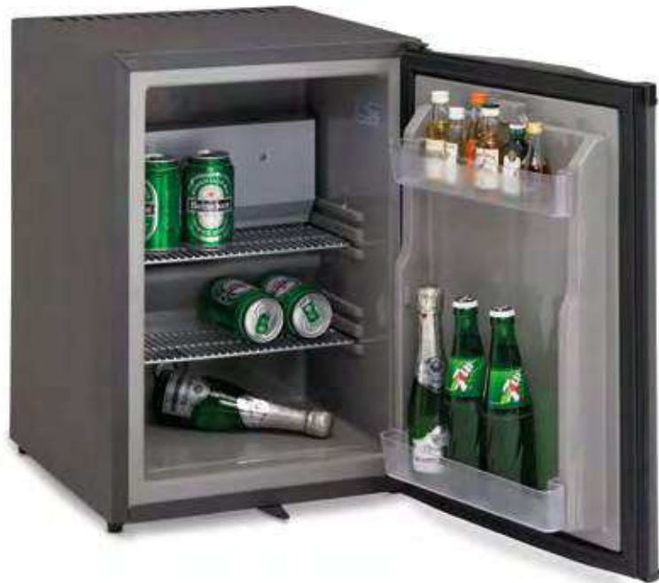
TM 42 (Puerta abierta)